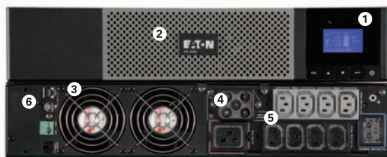
Eaton 5PX 3000i RT2U